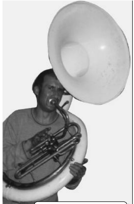
BOUCHE, LES MAINS DU NAIN

Suite à cette journée, la Fanfare Marseillaise devient pour tout bon Marseillais symbole d'une MEGA TEUF. L'expression « Ce soir, on vous met le feu » disparaît au profit de « Ce soir, on joue dans la Fanfare Marseillaise »